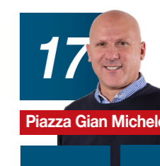
Piazza Gian Michele

18.03.66 Tecnico del Genio Civile Studio d'Ingegneria Mauri & Associati SA Consigliere Comunale in carica